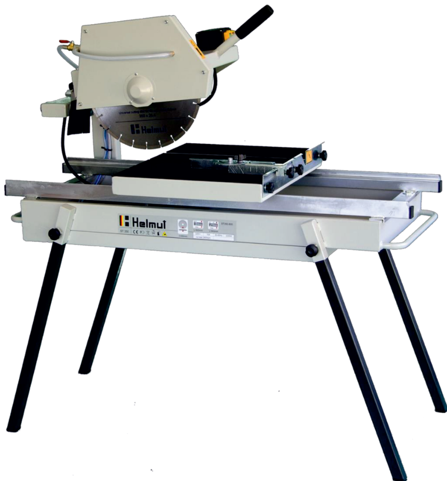
Рисунок 1 – Станок камнерезный серии ST

Станок камнерезный электрический предназначен для резки керамогранитной и тротуарной плитки, кровельной черепицы, гранита, базальта, мрамора, бордюрного и дорожного камня, строительных бетонных и газобетонных блоков.