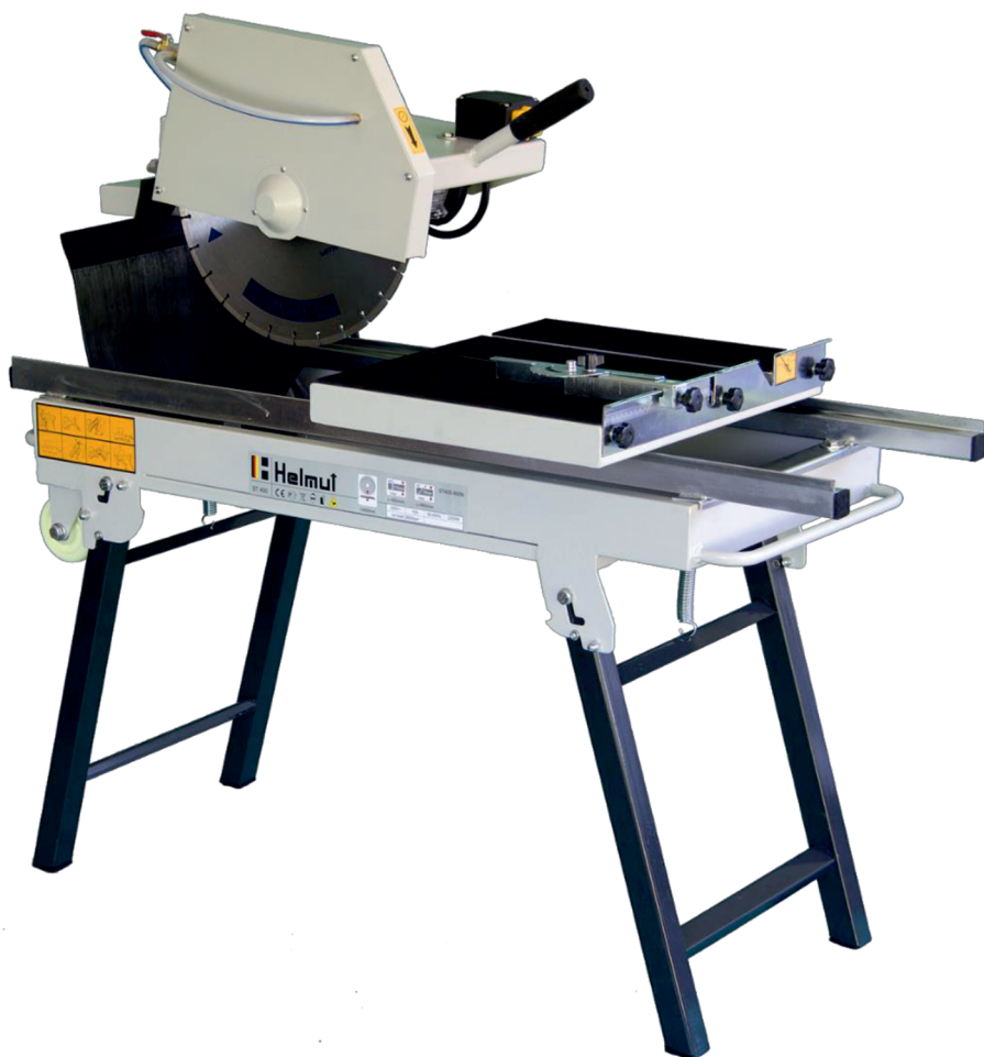
Рисунок 2 – Станок камнерезный серии ST/N

Станки камнерезные серии ST/N включает в себя все необходимое для начала работ. Отличаются от станков ST наличием усиленной рамы, крепких опор, поставляются в 9 различных вариантах с длиной реза 800, 900, 1000мм, а также дисками 350, 400, 450 метров.